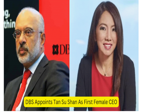
DBS Appoints Tan Su Shan As First Female CEO

(B) सिंगापुर की DBS ग्रुप होल्डिंग्स लिमिटेड ने घोषणा की है कि तन सु शान CEO के रूप में पदभार संभालेगी, जो दक्षिण पूर्व एशिया में सबसे बड़े बैंक का नेतृत्व करने वाली पहली महिला बनेगी। टैन जो वर्तमान में DBS में संस्थागत बैंकिंग के प्रमुख है, बैंक की अगली वार्षिक आम बैठक के साथ 28 मार्च 2025 को अपनी सेवानिवृत्ति पर वर्तमान सीईओ पीयूष गुप्ता की जगह लेने के लिए तैयार है।